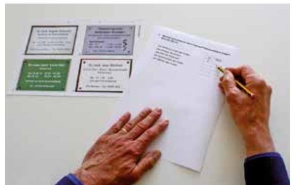
■ Abb. 5: Übungen zur Informationsentnahme (Weng & Storch 2013b, 44)