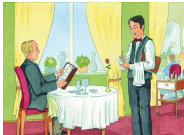
■ Abb. 10: Situationsbild „Im Restaurant“ (Pustlauk & Weng 2008)

Freie T-P-Interaktion halten wir für sinnvoll, um spontansprachliche Äußerungen zu provozieren, bei schwer betroffenen AphasikerInnen auch in Form einer Ja/Nein-Kommunikation. Für die gezielte Förderung der dialogischen Interaktion, gerade auch bei