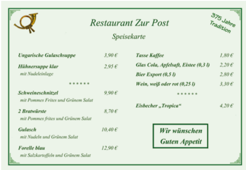
■ Abb. 16: Gebrauchstext „Speisekarte“ (vereinfacht nach Weng & Storch 2013b, Text T43)

Zur kommunikativen Situierung der Speisekarte kann zu Beginn dieses Schrittes das Situationsbild „Im Restaurant“ (Abb. 10) verwendet werden.